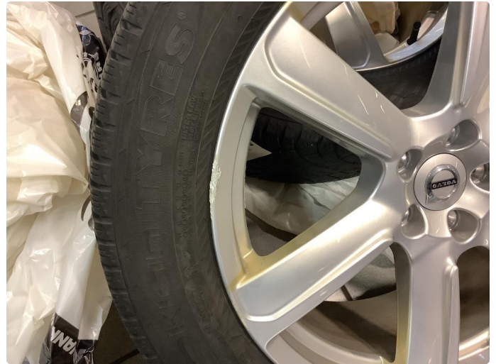
1.1 Skade på felg