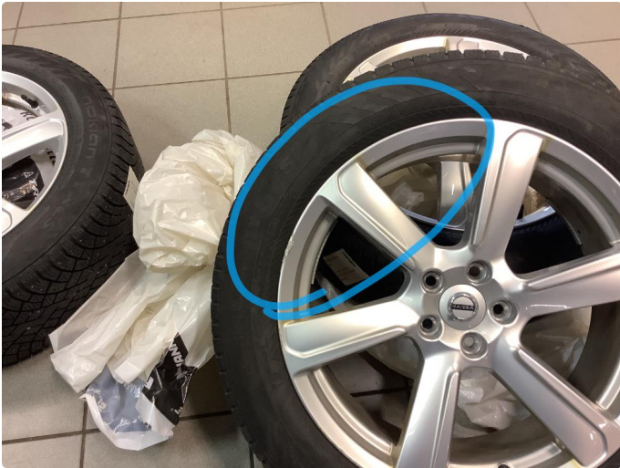
1.1 Skade på felg