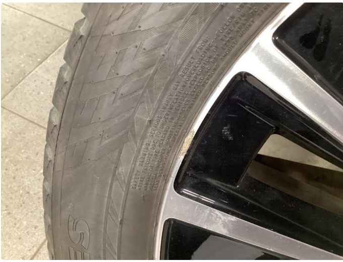
1.5 Kantkjørt felg