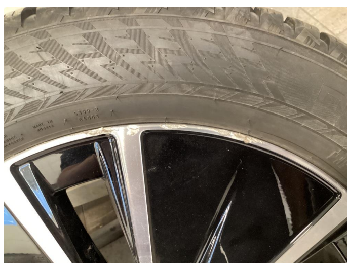
1.4 Kantkjørt felg