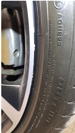
1.1 Kantkjørt felg