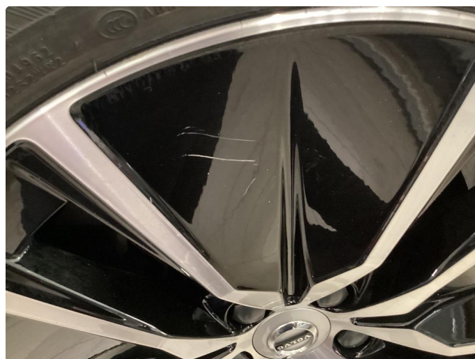
1.4 Skade på felg