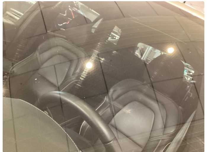
1.1 Sliteriper i synsfelt