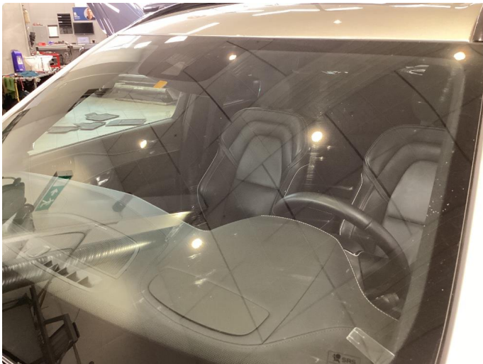
1.1 Sliteriper i synsfelt