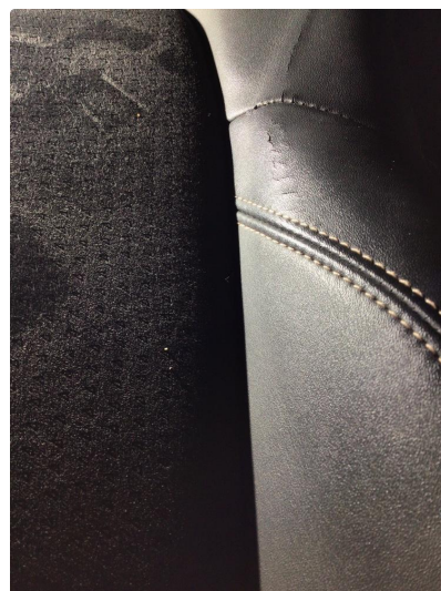
3.1 Skade på setepute