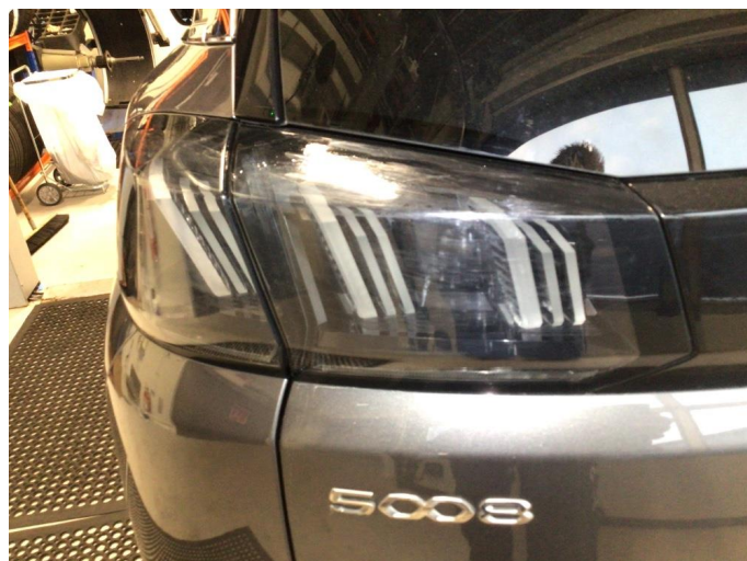
2.1 Matte glass