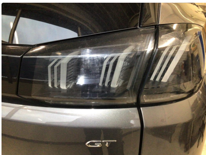
2.1 Matte glass