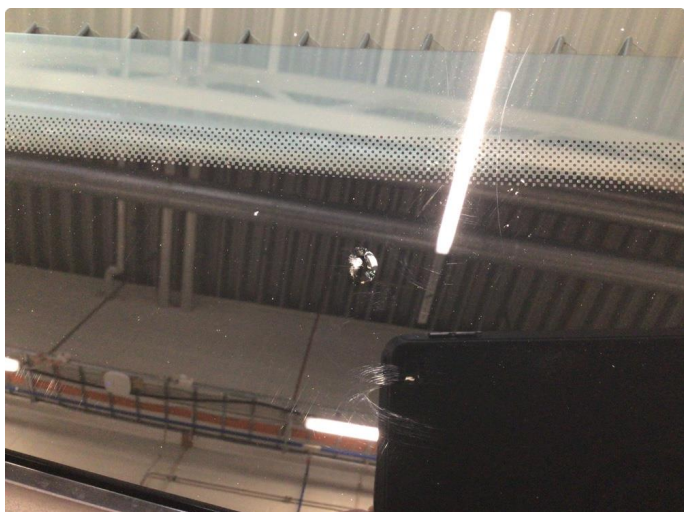
1.1 Steinsprut, skiftes