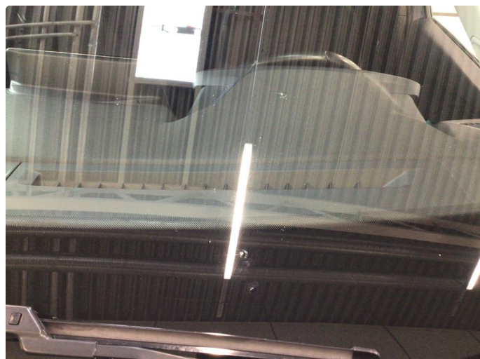
1.1 Steinsprut, skiftes