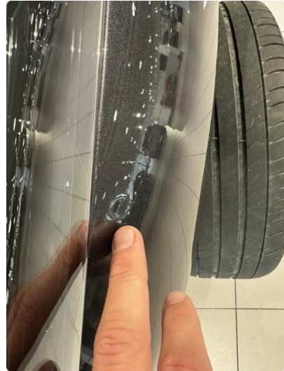
1.2 Bulk venstre forskjem