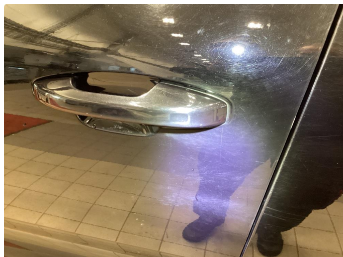
1.1 Riper - Normalt på sort bil - Rubbet og polert