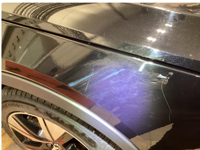
1.1 Riper - Normalt på sort bil - Rubbet og polert