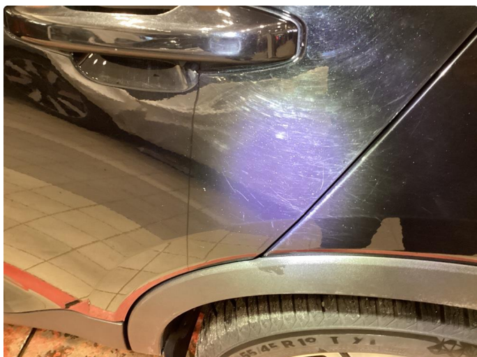
1.1 Riper - Normalt på sort bil - Rubbet og polert