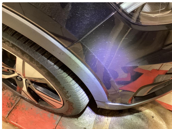
1.1 Riper - Normalt på sort bil - Rubbet og polert