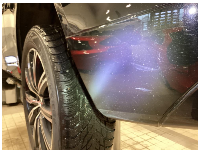
1.5 Riper - Polert bort og lagt folie i innlastning