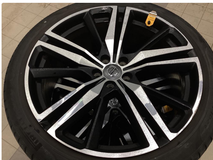
1.2 Kantkjørt felg Diamond Cut