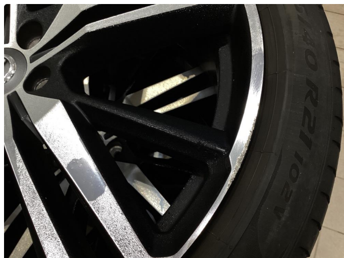
1.2 Kantkjørt felg Diamond Cut