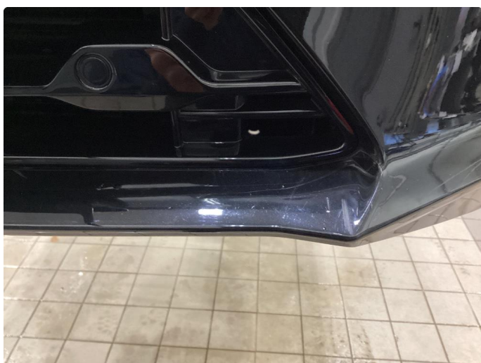
1.4 Ripe - Dette er lakkert