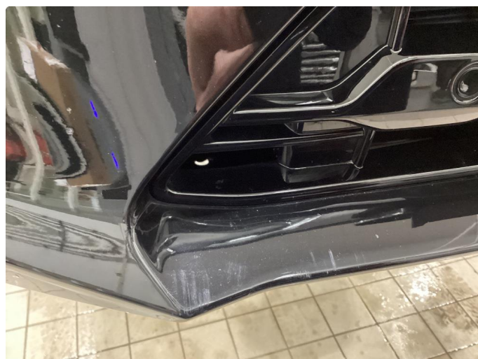
1.4 Ripe - Dette er lakkert