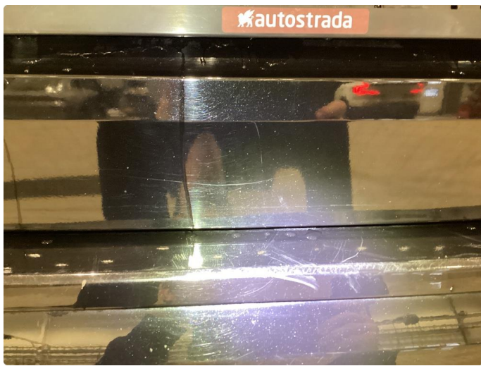
1.5 Riper - Polert bort og lagt folie i innlastning