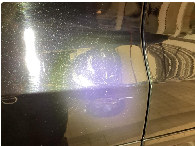
1.1 Riper . Polert bort