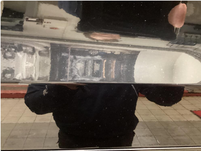
1.2 Ripe ned til grunning