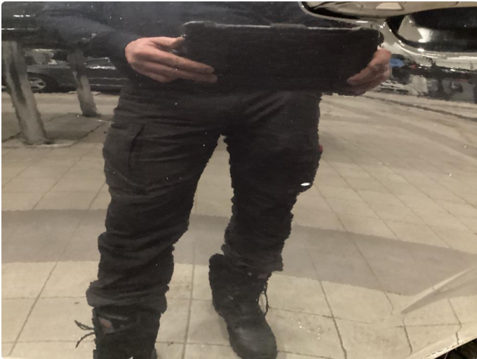
1.4 Ripe ned til grunning