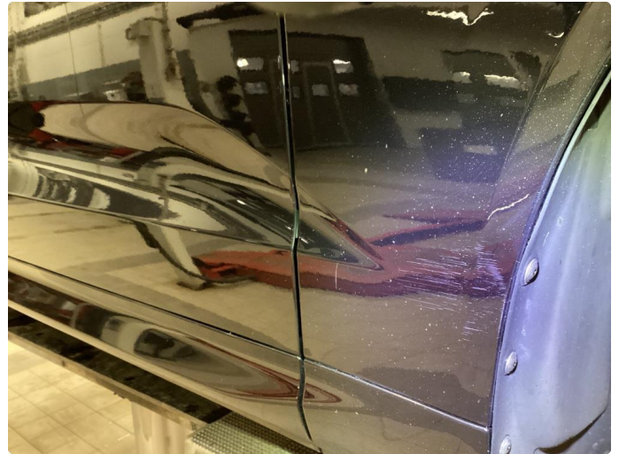
1.5 Ripe(r) ned til grunning