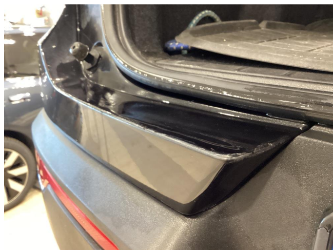
1.3 Ripe ned til grunning - Flekket