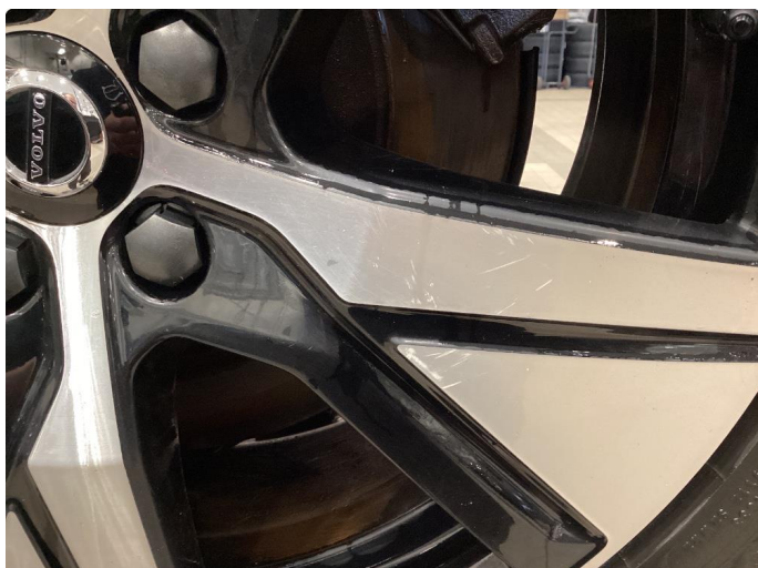
1.1 Ripe gjennom lakk