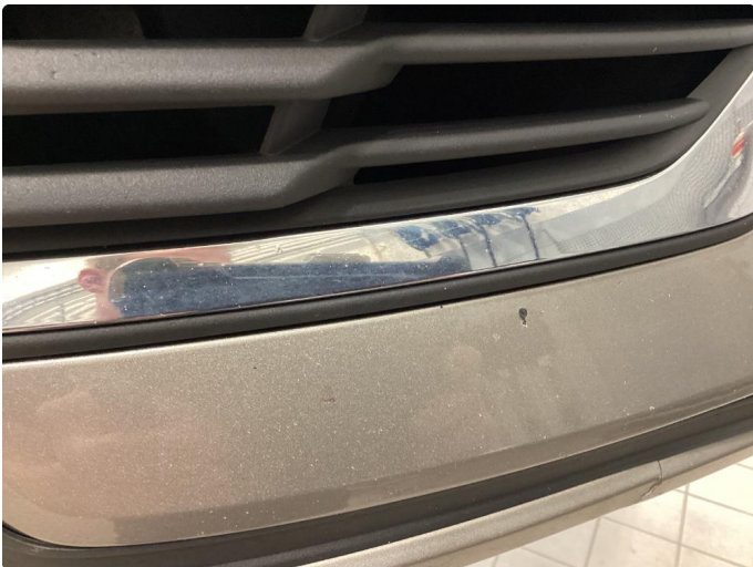
1.2 Steinsprut - Lakkert