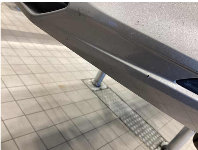
1.2 Steinsprut - Lakkert