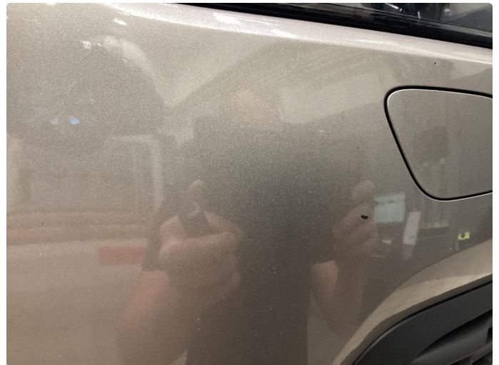
1.2 Steinsprut - Lakkert