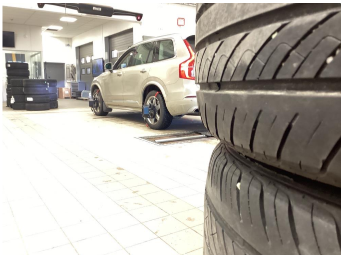
1.1 Skjevslitasje - nye dekk montert