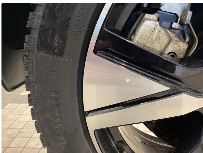
1.3 Par små hakk i klarlakk