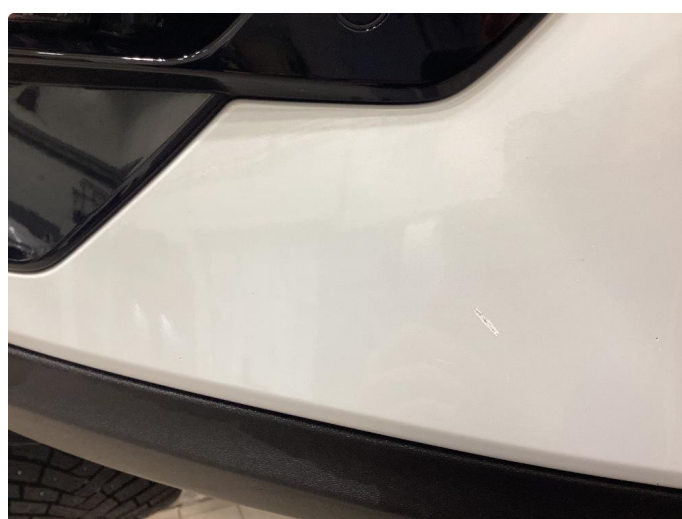
1.5 Lite skrap i klarlakken på plasten på støtfanger