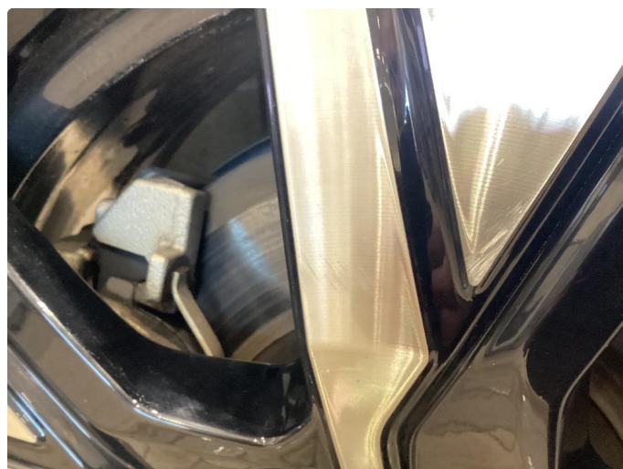
1.3 Par små hakk i klarlakk