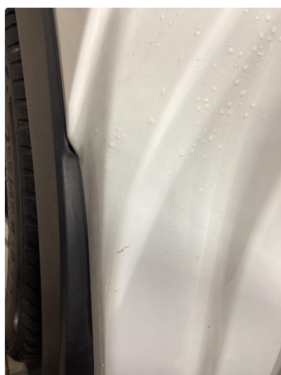
1.4 En liten ripe i døråpning