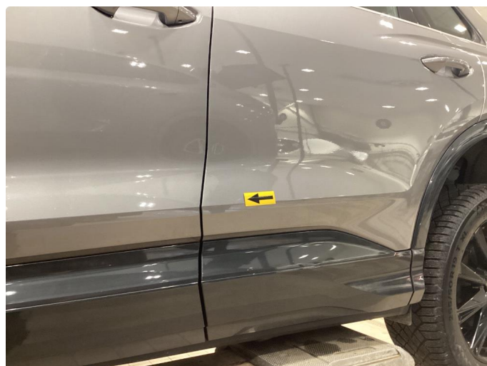
1.2 Bulk - Fikset med lakkeringsfri bulk rep