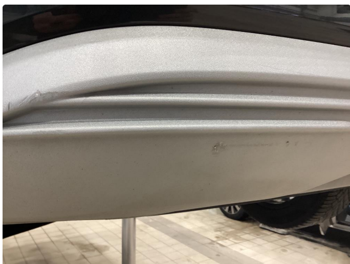
1.5 Skrap i plasten i nedre del av støtfanger