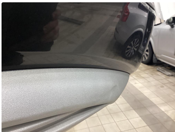
1.5 Skrap i plasten i nedre del av støtfanger