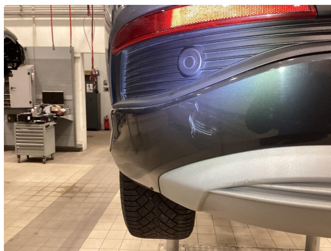
1.4 Skrap i sort felt i plastikk