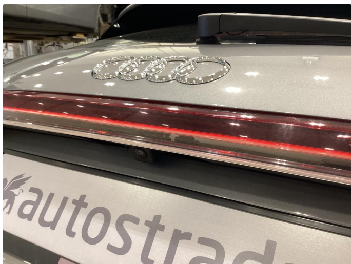
2.1 Krakelering i plast