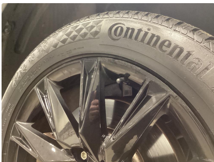
1.3 Kantkjørt felg - Lagt lakk og er nesten ikke synlig