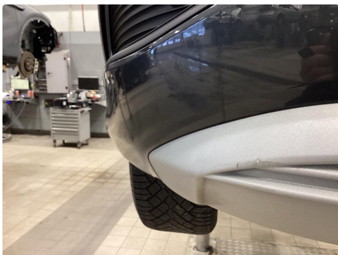
1.5 Skrap i plasten i nedre del av støtfanger