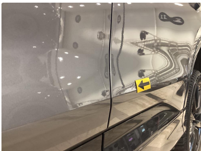
1.2 Bulk - Fikset med lakkeringsfri bulk rep