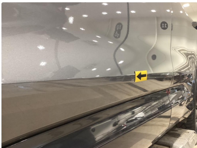
1.1 Bulk - Fikset med lakkeringsfri bulk rep