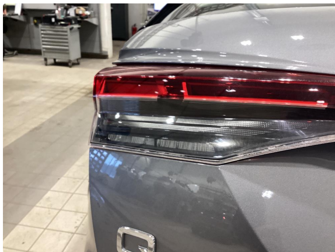
2.1 Krakelering i plast