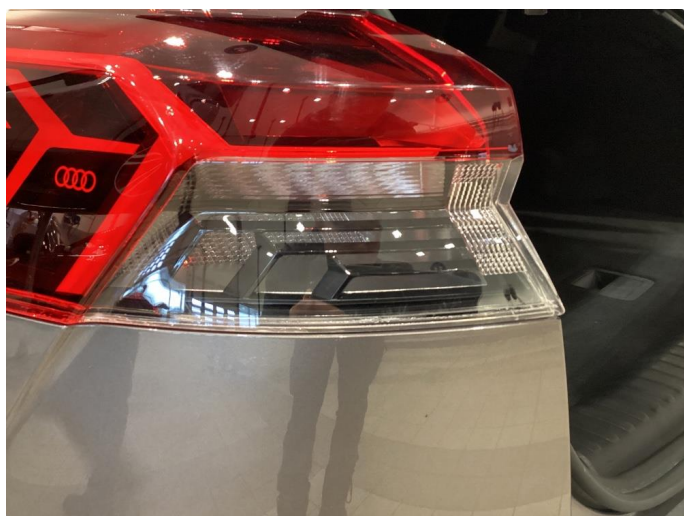
2.1 Krakelering i plast