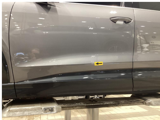
1.1 Bulk - Fikset med lakkeringsfri bulk rep