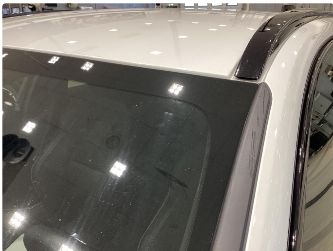
1.6 Feil på list - Byttet til ny