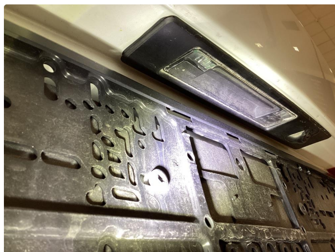
2.2 Krakelering i plast - Byttet på garanti