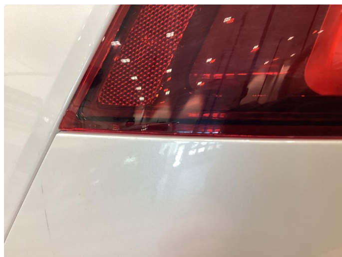
2.1 Krakelering i plast - Byttet på garanti