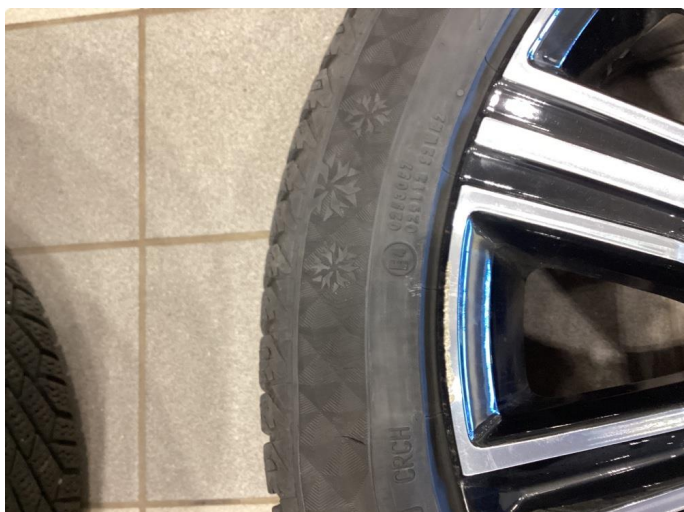
1.1 Kantkjørt felg Diamond Cut - byttet til ny felg