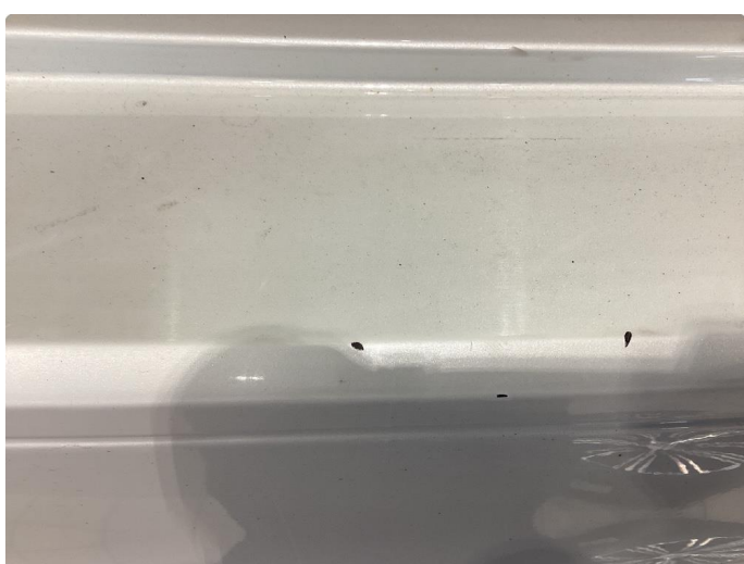
1.4 Skade - flekket