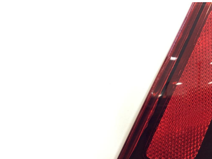
2.1 Krakelering i plast - Byttet på garanti