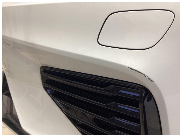
1.3 Ripe(r) ned til grunning - Flekket