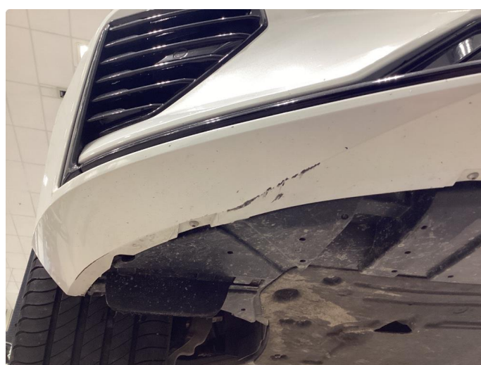
1.5 Skrubbskader underkant - flekket