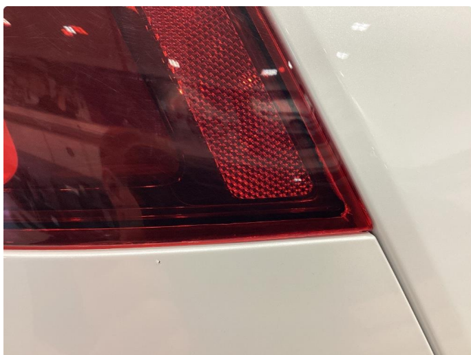
2.1 Krakelering i plast - Byttet på garanti