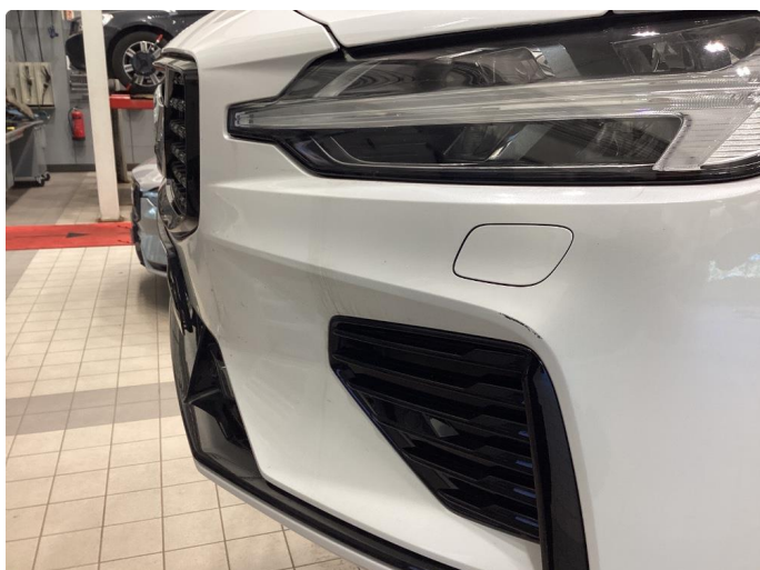
1.3 Ripe(r) ned til grunning - Flekket