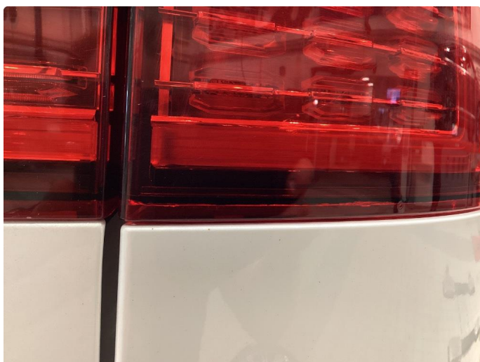
2.1 Krakelering i plast - Byttet på garanti