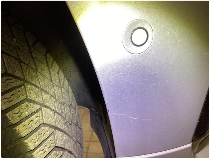
1.1 Ripe - Rubbet og polert