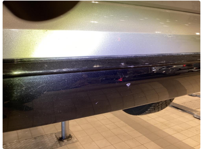
1.2 Ripe - Tonet ned med rubbing og Polering