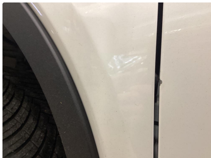
1.1 Ripe ned til grunning - Dette blir lakkert og fikset på garanti