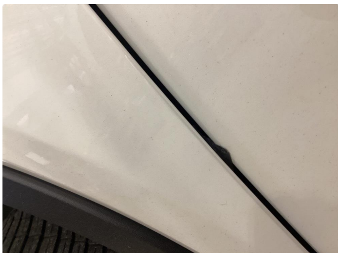
1.1 Ripe ned til grunning - Dette blir lakkert og fikset på garanti