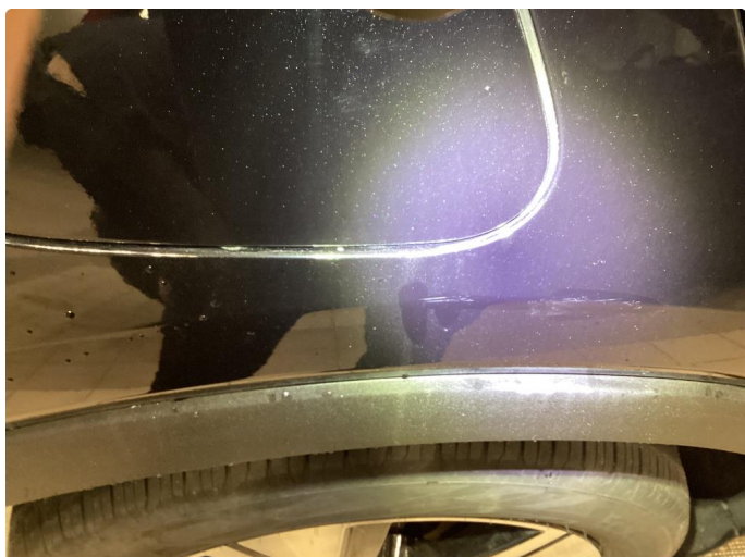
1.1 Overfalte ripe - rubbet og polert vekk