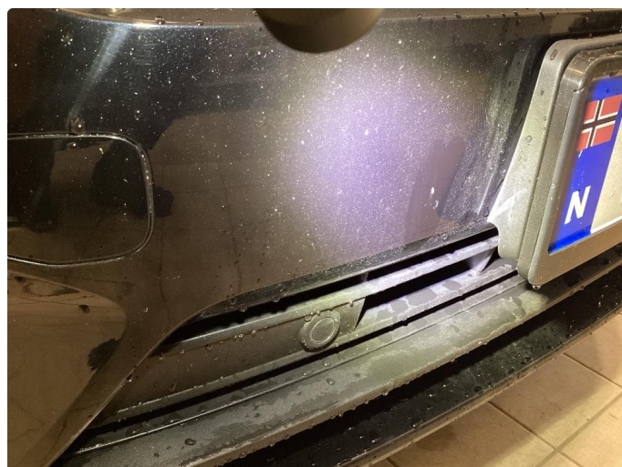
1.2 Steinsprut - Flekket