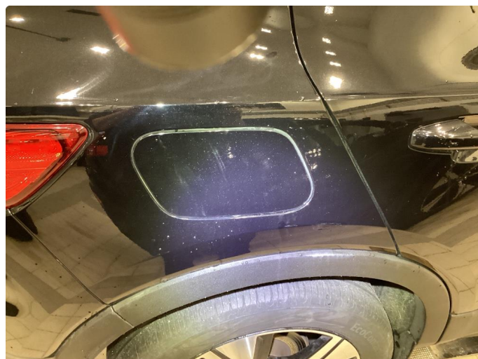
1.1 Overfalte ripe - rubbet og polert vekk