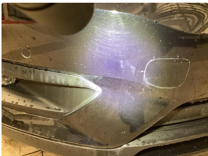
1.2 Steinsprut - Flekket