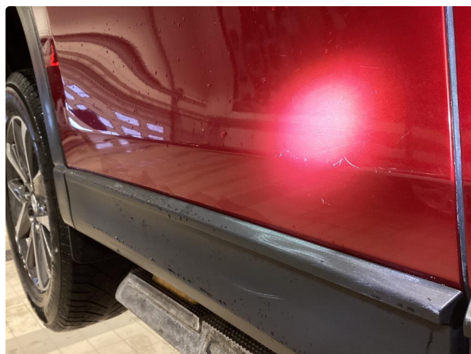
1.2 Riper - Tonet ned med polering