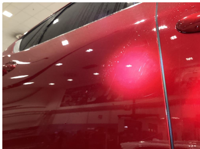
1.2 Riper - Tonet ned med polering