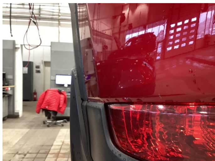
1.4 Ripe(r) ned til grunning - Tonet ned med polering