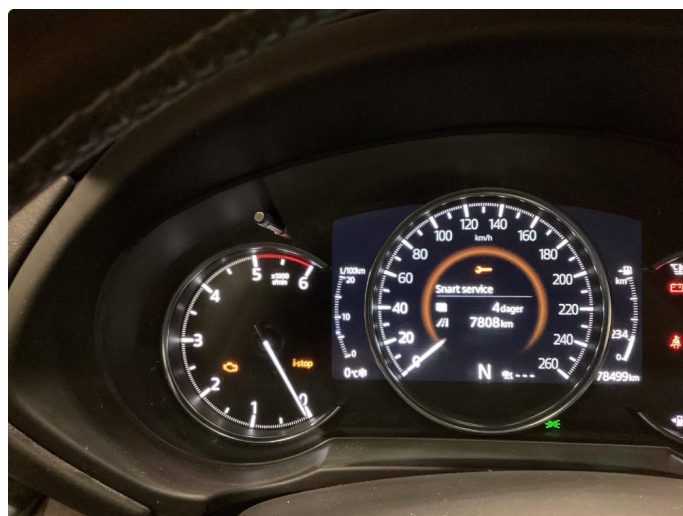
2.1 Varsler service - Service utføres/utført 31.03.2025