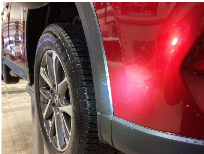
1.5 Ripe - Tonet ned med polering