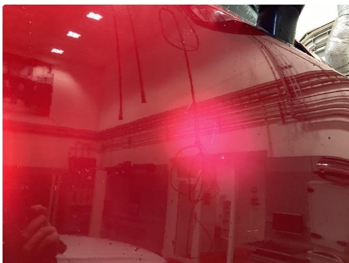
1.2 Riper - Tonet ned med polering