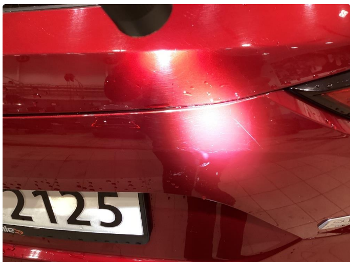
1.1 Generelt mye riper