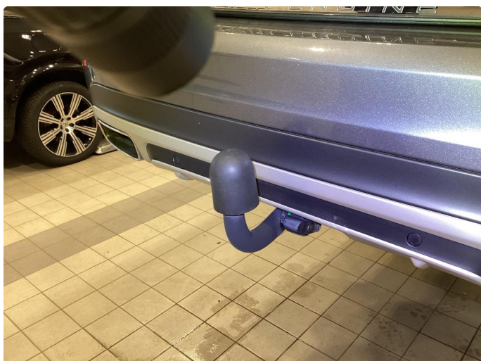
1.2 Et lite merke etter tilhenger