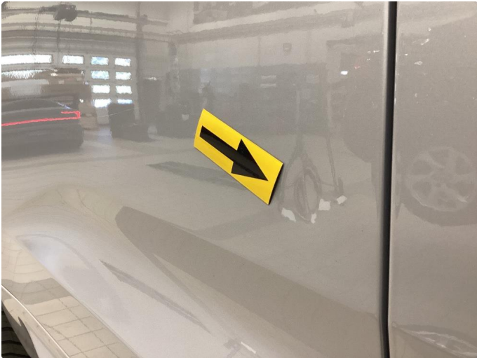
1.1 Parkbukk - Rettet