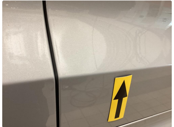
1.2 Parkbukk - Rettet