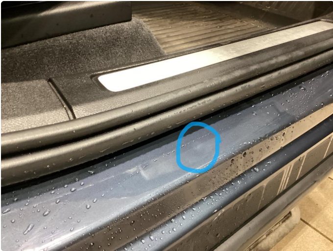
1.1 Bulk - Reparerer med bulkrep