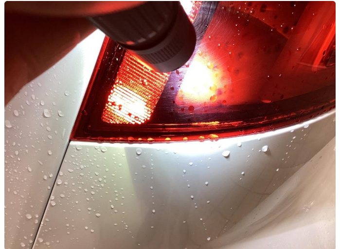
2.1 Krakelering i plast - Byttet på garanti