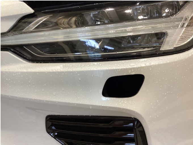
1.1 Deksler mangler - montert nytt