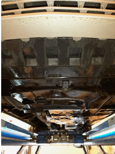
1.1 Bruksmerke på plate under bil.