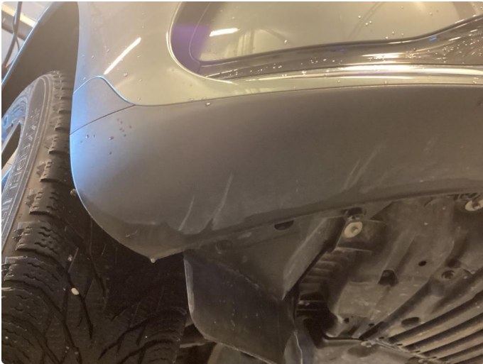
1.1 Liten ubetydelige skrubbskader underkant