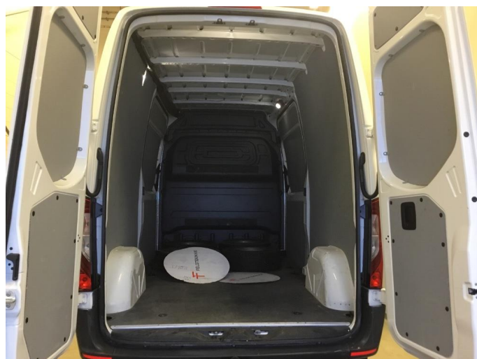
2.1 Diverse bruksmerker/mindre bulker i varerom.