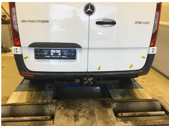
1.1 Div.mindre bruksmerker fangerplast bak.