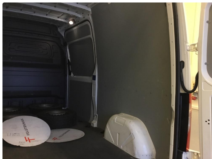
2.1 Diverse bruksmerker/mindre bulker i varerom.