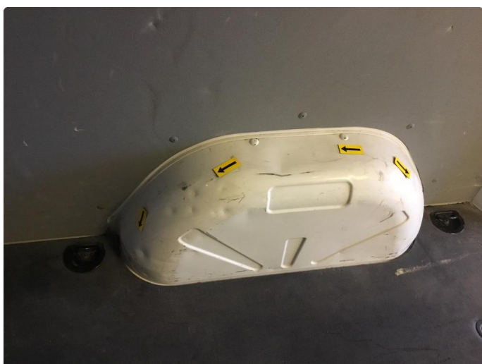
2.1 Diverse bruksmerker/mindre bulker i varerom.