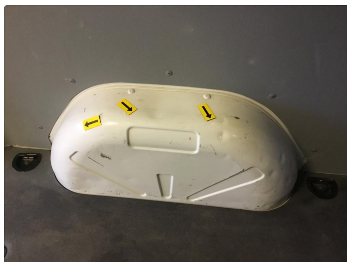
2.1 Diverse bruksmerker/mindre bulker i varerom.