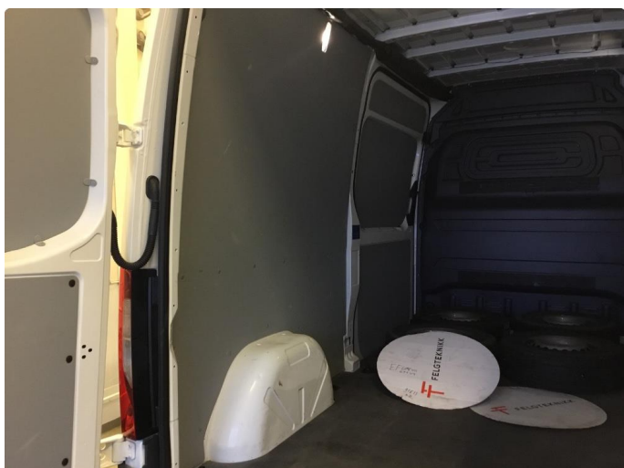
2.1 Diverse bruksmerker/mindre bulker i varerom.