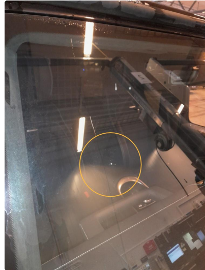
1.1 Reparert steinsprutskade