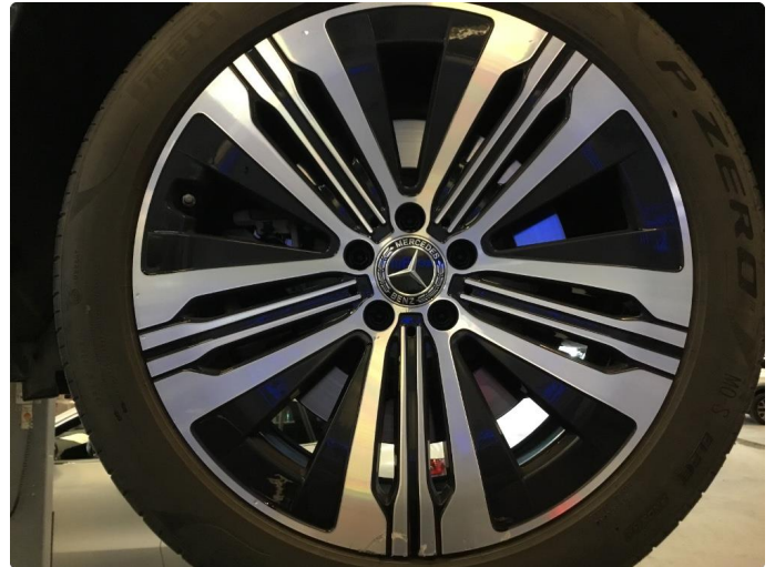
1.1 Bruksmerke / noe striper / kantkjørt sommerfelg venstre bak.