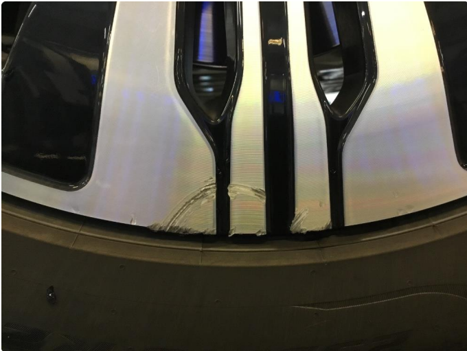
1.1 Bruksmerke / noe striper / kantkjørt sommerfelg venstre bak.