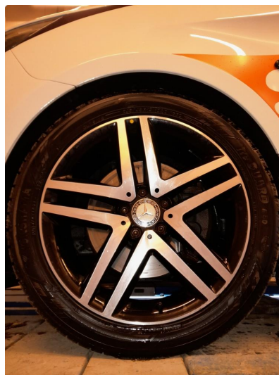
1.1 Diverse bilder