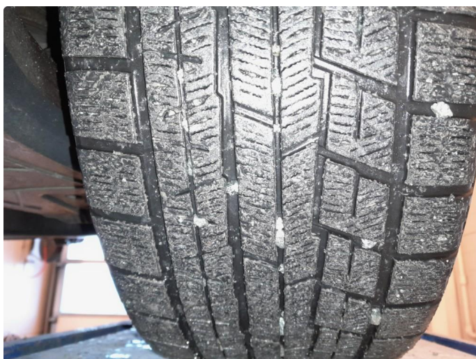
1.1 Diverse bilder