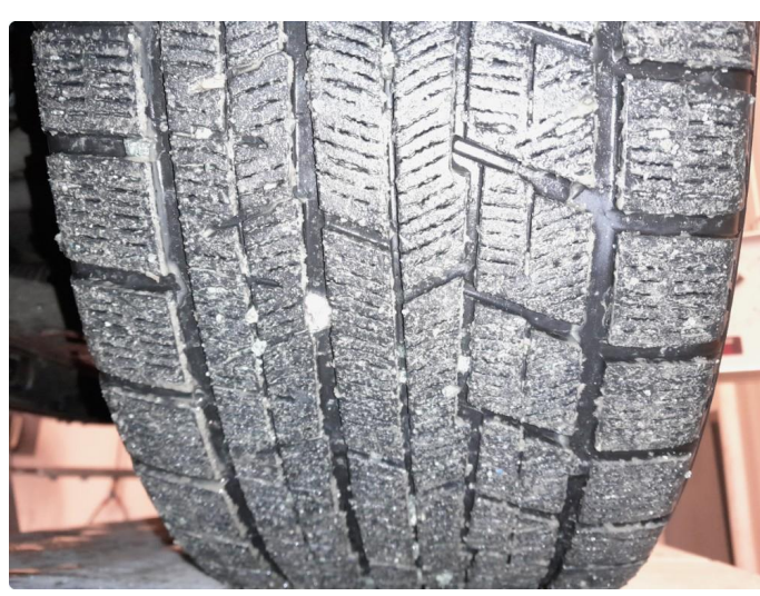
1.1 Diverse bilder