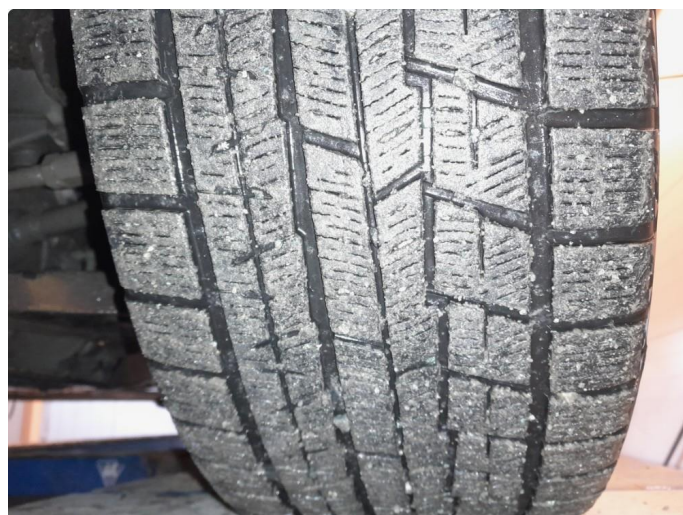
1.1 Diverse bilder