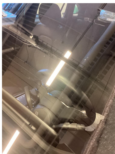
1.2 Bruksmerke på frontrute