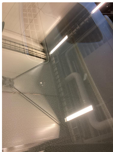
1.2 Bruksmerke på frontrute