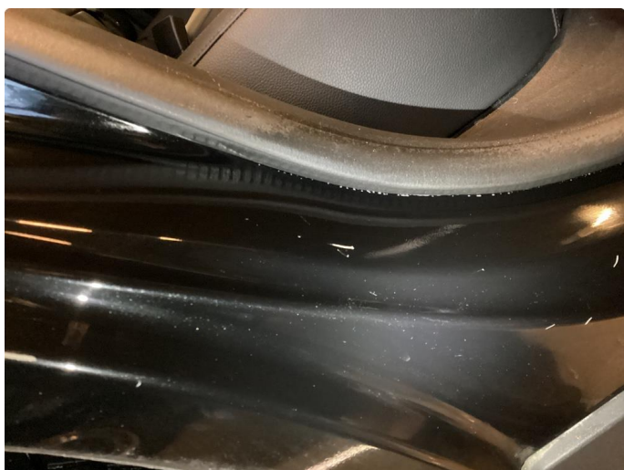
1.1 Flekket med lakkstift