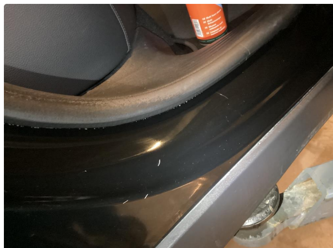
1.1 Flekket med lakkstift