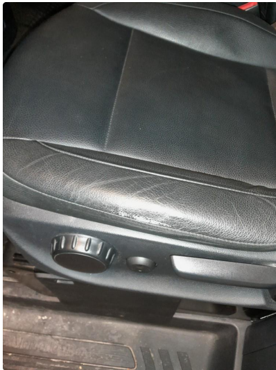
2.1 Setetrekk har bruksmerke.