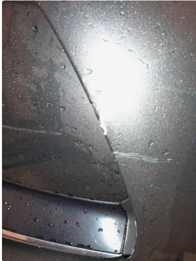
1.1 Flekket støtfanger foran