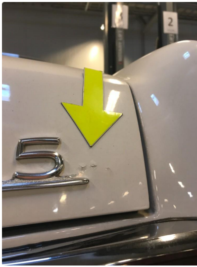
1.1 Diverse nærbilder av lakk, bruksmerker og korrosjonsbobler