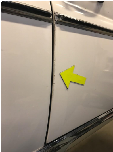
1.1 Diverse nærbilder av lakk, bruksmerker og korrosjonsbobler