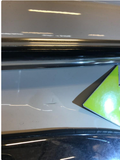
1.1 Diverse nærbilder av lakk, bruksmerker og korrosjonsbobler