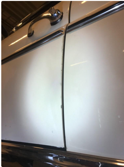
1.1 Diverse nærbilder av lakk, bruksmerker og korrosjonsbobler