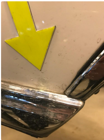
1.1 Diverse nærbilder av lakk, bruksmerker og korrosjonsbobler