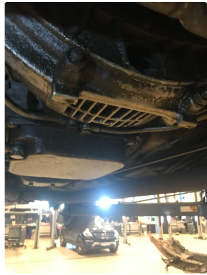
1.2 Biler av bilen under.