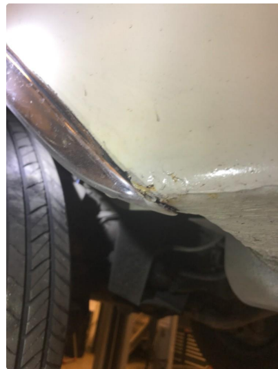
1.1 Diverse nærbilder av lakk, bruksmerker og korrosjonsbobler