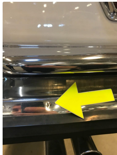
1.1 Diverse nærbilder av lakk, bruksmerker og korrosjonsbobler