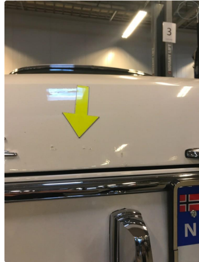
1.1 Diverse nærbilder av lakk, bruksmerker og korrosjonsbobler