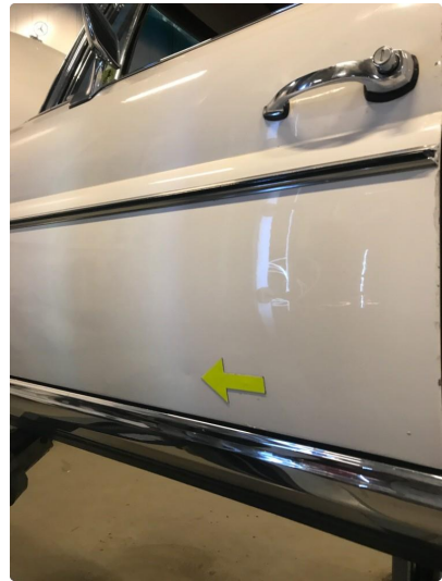
1.1 Diverse nærbilder av lakk, bruksmerker og korrosjonsbobler