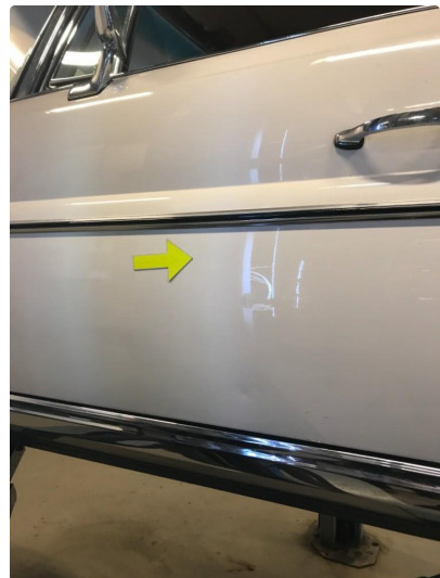
1.1 Diverse nærbilder av lakk, bruksmerker og korrosjonsbobler