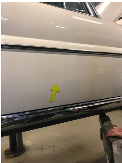
1.1 Diverse nærbilder av lakk, bruksmerker og korrosjonsbobler