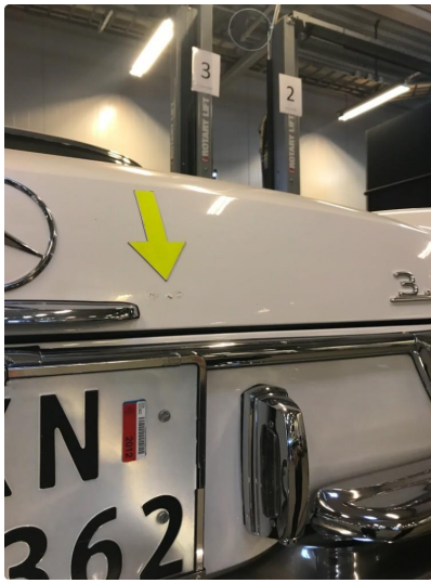
1.1 Diverse nærbilder av lakk, bruksmerker og korrosjonsbobler