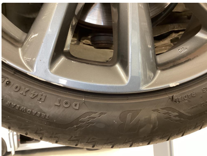
1.7 Kantkjørt felg