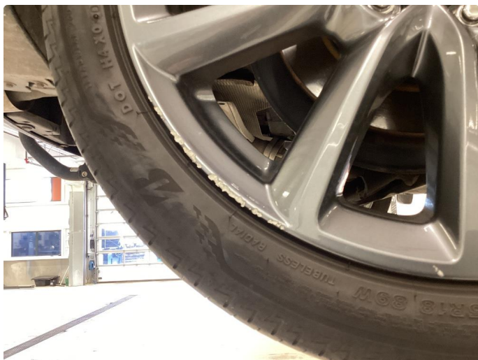
1.7 Kantkjørt felg