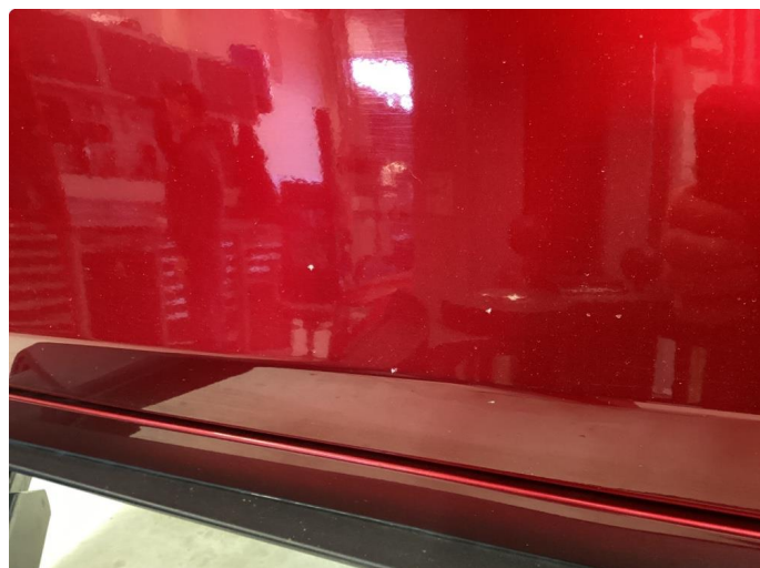
1.2 Noe steinsprut