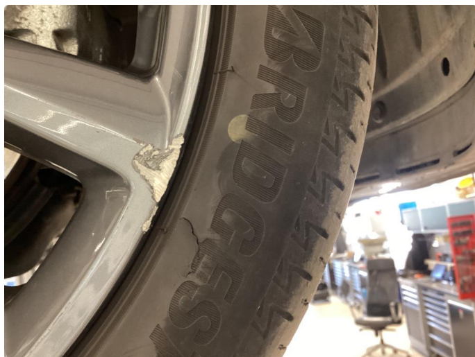
1.7 Kantkjørt felg