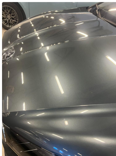
1.1 Noe steinsprut rundt om på bilen.