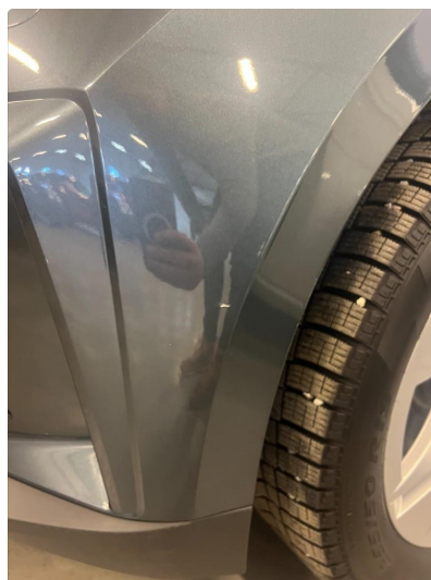
1.1 Noe steinsprut rundt om på bilen.