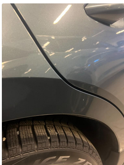
1.1 Noe steinsprut rundt om på bilen.