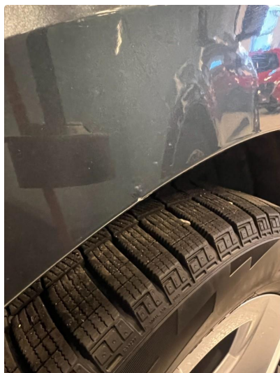
1.1 Noe steinsprut rundt om på bilen.