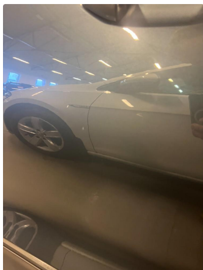
1.1 Noe steinsprut rundt om på bilen.