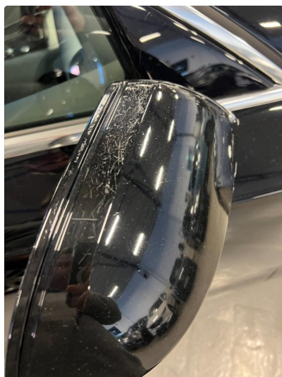
1.3 Merker i speil høyre side