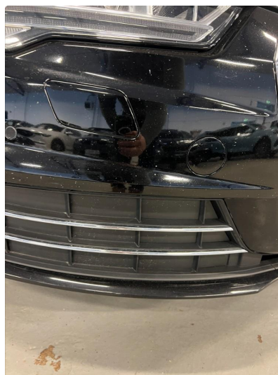
1.5 Steinsprut frontfanger.