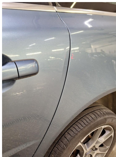
1.1 Merke på dør