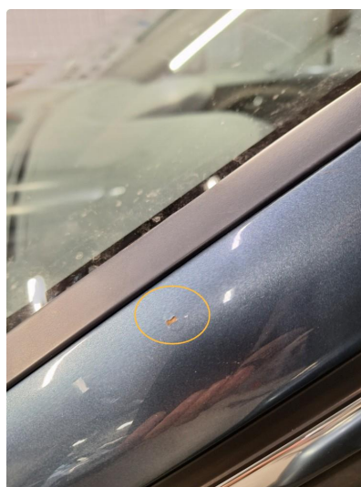
1.2 Noen steinsprut på bilen. (Normal mengde iht. alder og kjørelengde)