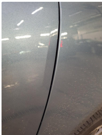
1.1 Merke på dør