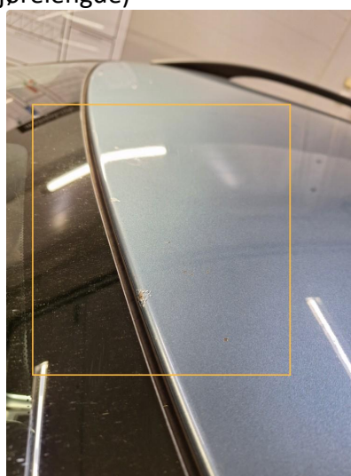
1.2 Noen steinsprut på bilen. (Normal mengde iht. alder og kjørelengde)