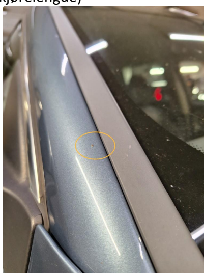
1.2 Noen steinsprut på bilen. (Normal mengde iht. alder og kjørelengde)