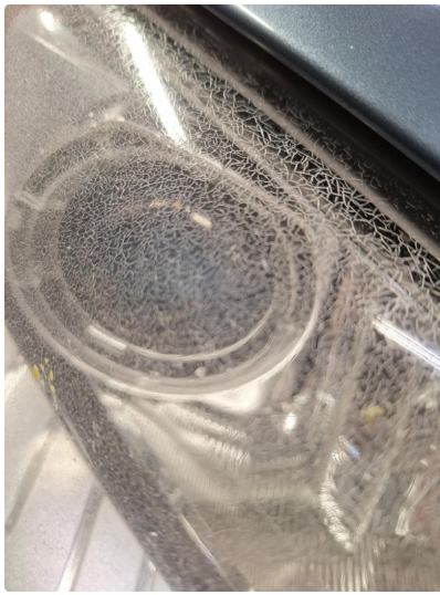
2.1 Normal bruksslitasje på frontlykter iht. alder og kjørelengde.