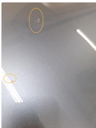
1.2 Noen steinsprut på bilen. (Normal mengde iht. alder og kjørelengde)