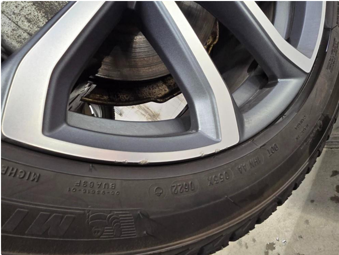
1.1 Lite skrubbermerke på felg venstre foran. Ubetydelig