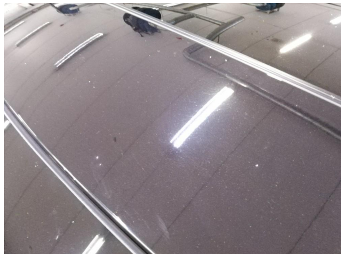
1.2 Steinsprut med rust