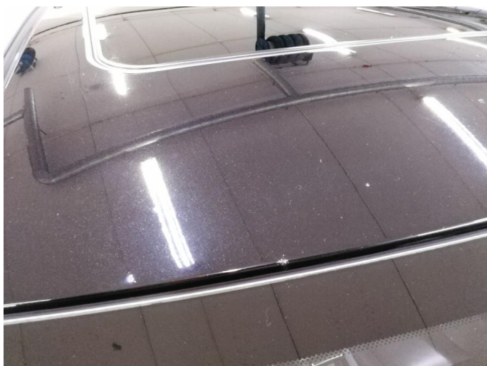
1.2 Steinsprut med rust