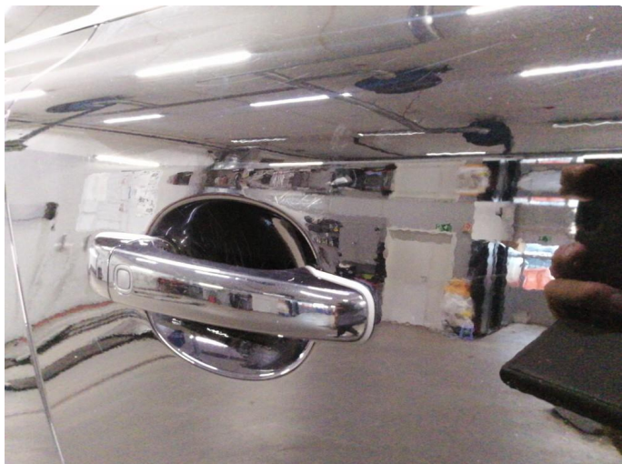
1.1 Bulk med lakkskade