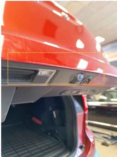
1.1 Lakk flasser