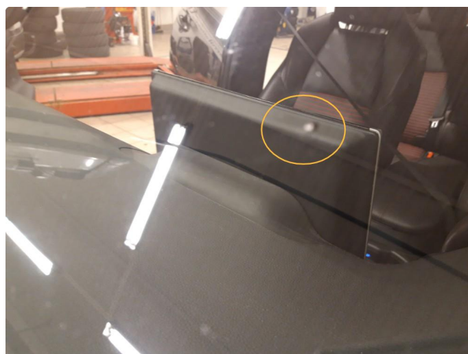
1.3 Liten steinsprut