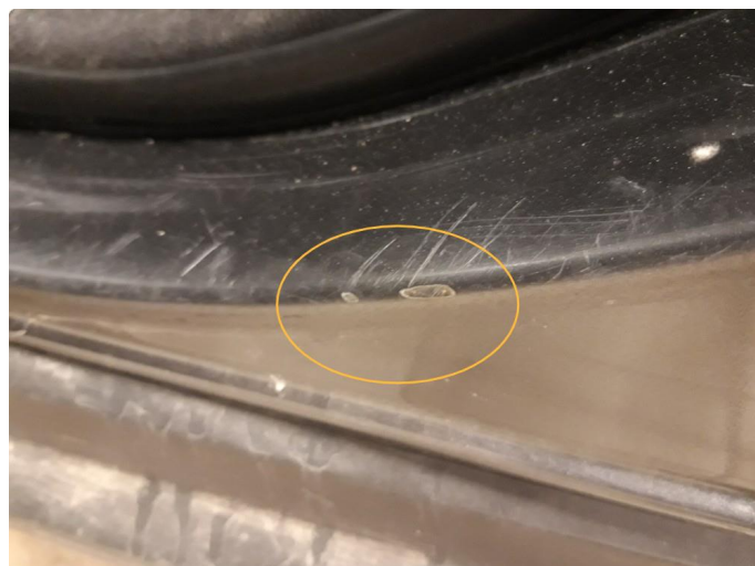
1.1 Noen små riper, rubbes og poleres.