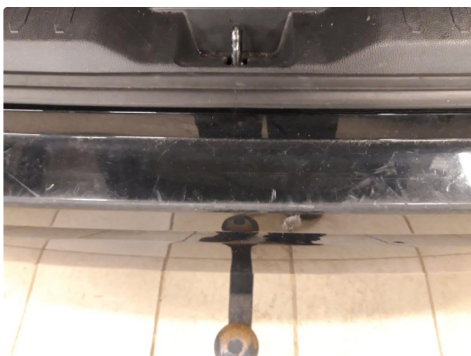
1.2 Noe riper på plastikk (innlasting til bagasjerom)