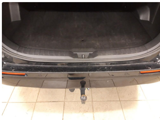
1.2 Noe riper på plastikk (innlasting til bagasjerom)