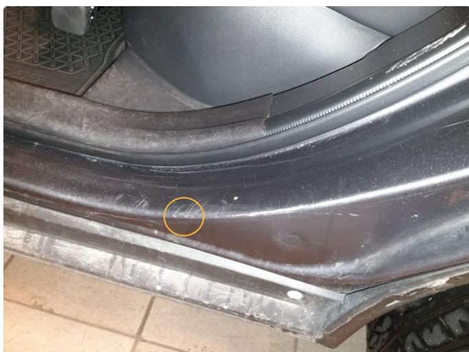
1.1 Noen små riper, rubbes og poleres.