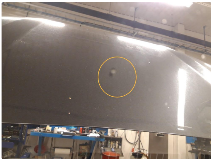
1.3 Liten steinsprut