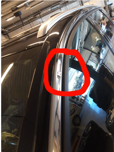
1.1 Liten bulk i listen