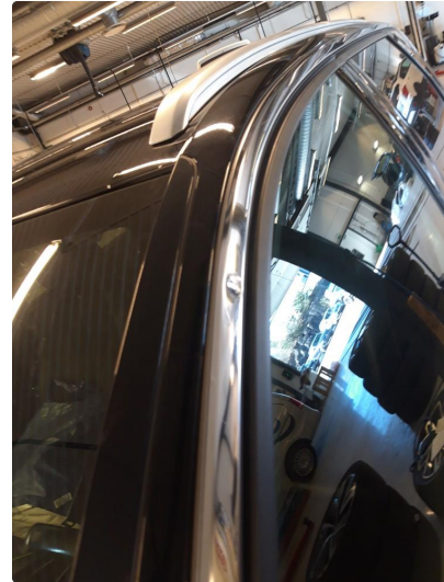
1.1 Liten bulk i listen