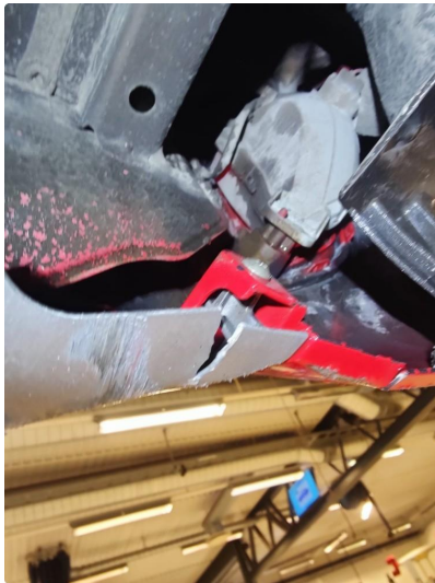
1.1 Liten bulk