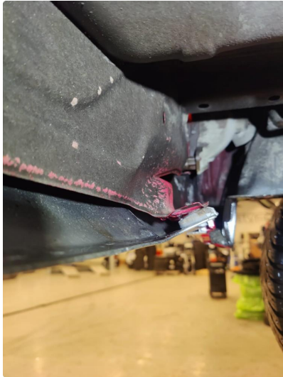
1.1 Liten bulk