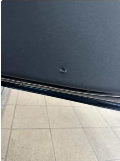
2.1 Lite hakk i dørtrekk høyre foran.