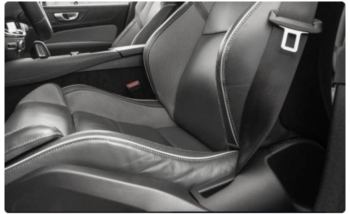
2.2 Bruktslitasje fører sete.