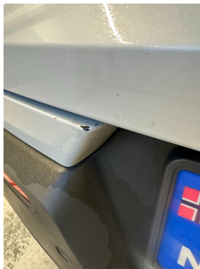
1.1 Riper støtfanger bak.