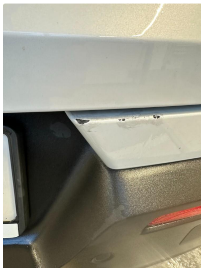
1.1 Riper støtfanger bak.