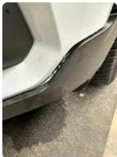
1.2 Nedre støtfangerlist ute av plassisjon venstre foran.