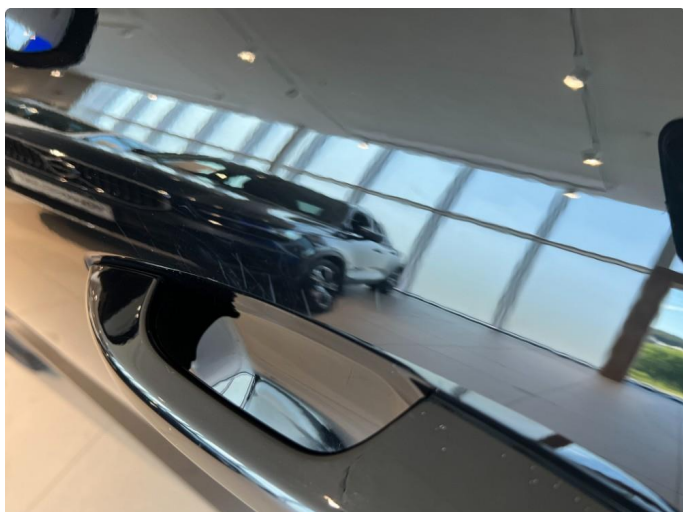
1.1 Ripper rundt håndtak førerdør.