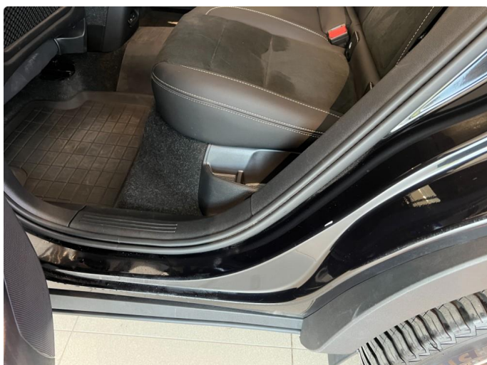
1.3 Ripe døråpning venstre bak.