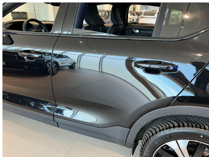
1.2 Minibulk dør venstre bak