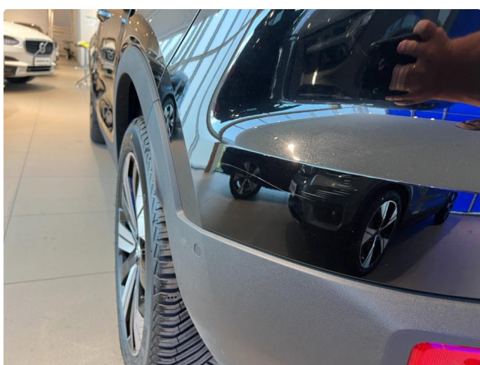
1.5 Ripper støtfangerhjørne venstre bak.