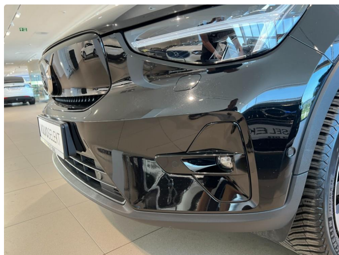
1.4 Noe steinsprut støtfanger foran.