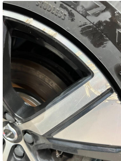
1.2 Riper i 2 felger.