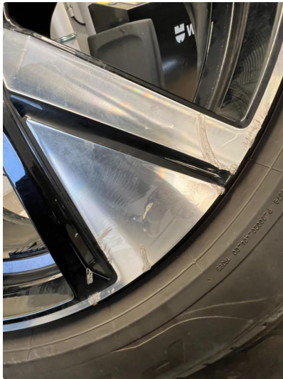
1.2 Riper i 2 felger.