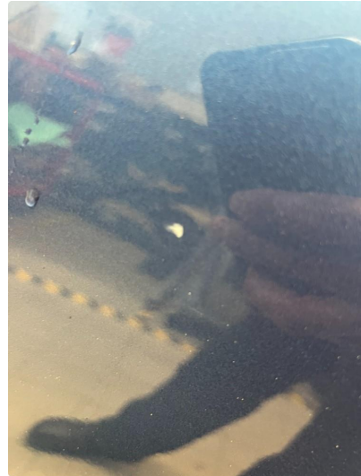
1.1 Minibulk dør høyre bak.