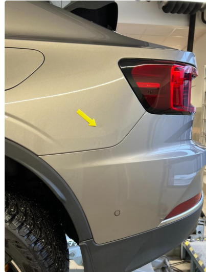
1.2 Minibulk bakskjerm venstre.