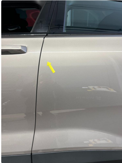
1.1 Minibulk dør venstre bak.