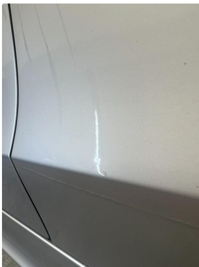
1.1 Liten bulk i dør h.f.