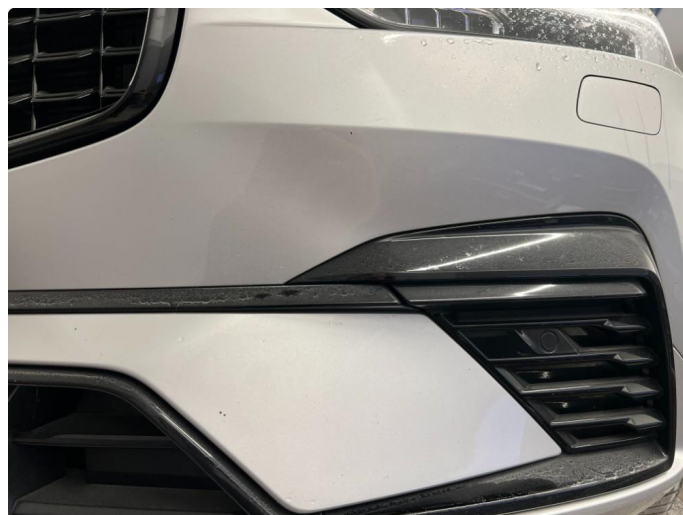
1.2 Noen steinsprut støtfanger foran. Normal slitasje.